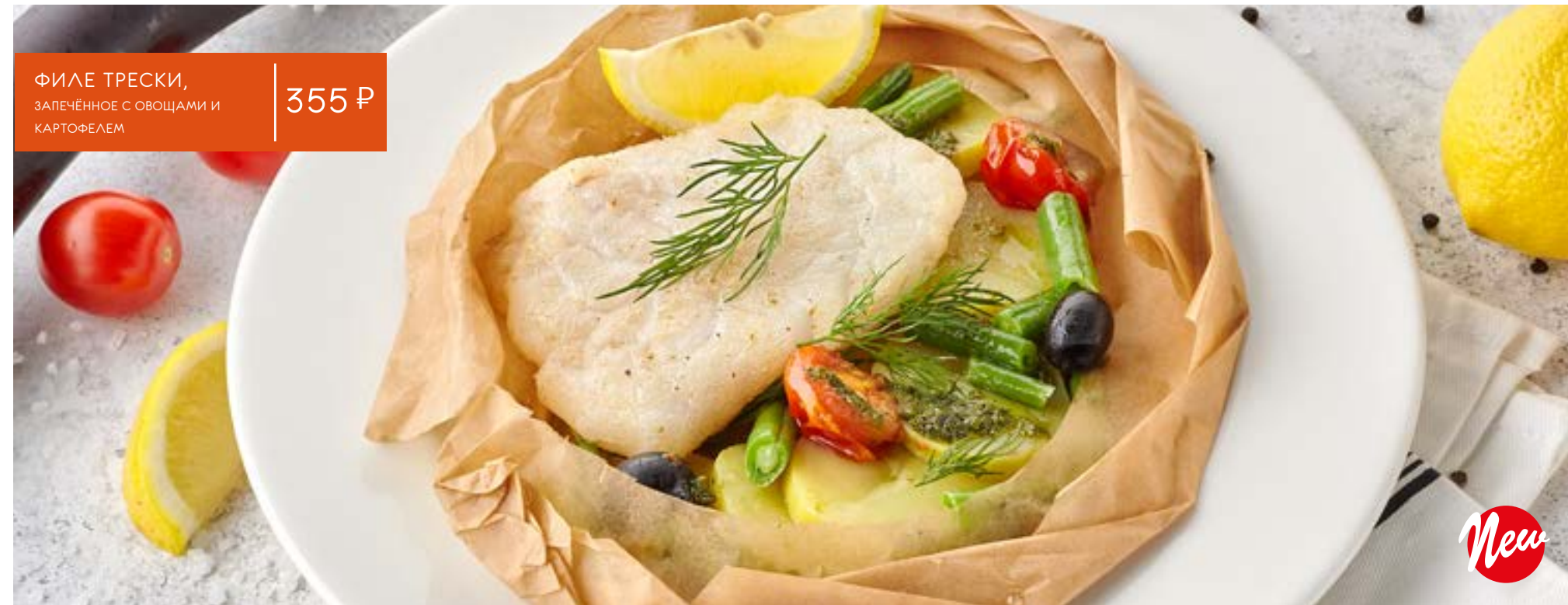
ФИЛЕ ТРЕСКИ, ЗАПЕЧЕННОЕ С ОВОЩАМИ И КАРТОФЕЛЕМ 355 Р