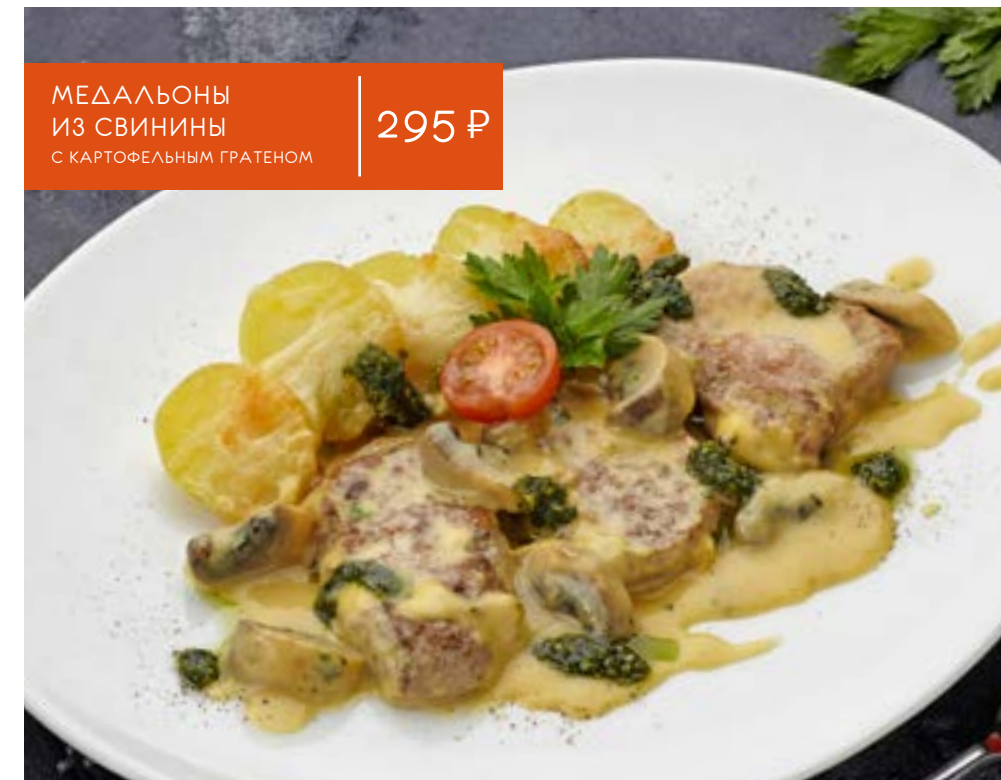
МЕДАЛЬОНЫ ИЗ СВИНИНЫ С КАРТОФЕЛЬНЫМ ГРАТЕНОМ 295 Р