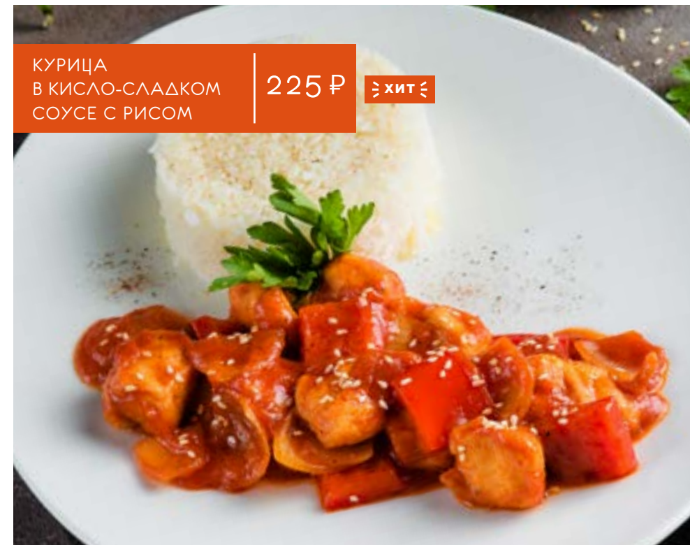
КУРИЦА В КИСЛО-СЛАДКОМ СОУСЕ С РИСОМ 225 Р