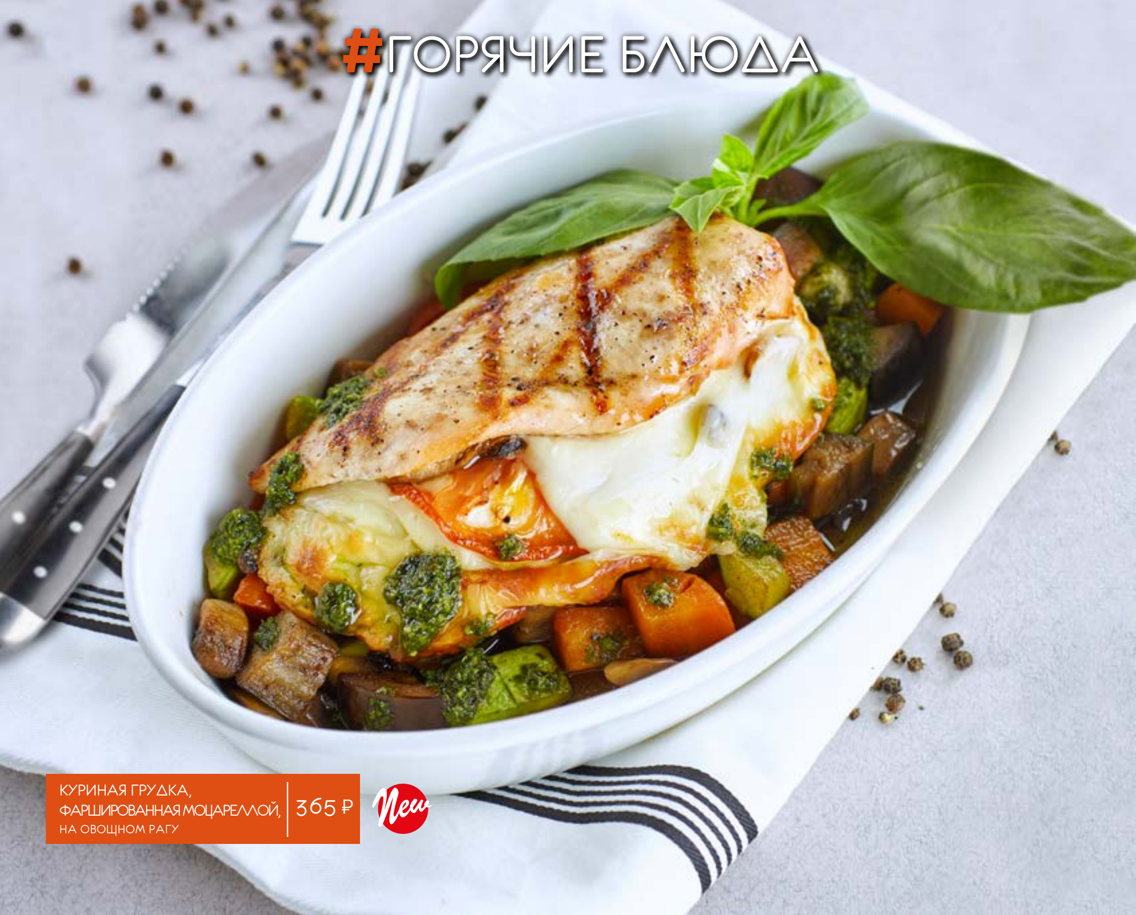
КУРИНАЯ ГРУДКА, ФАРШИРОВАННАЯ МОЦАРЕЛЛОЙ, НА ОВОЦНОМ РАТУ 365 Р